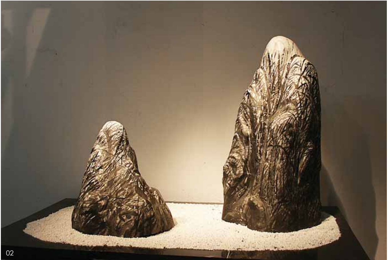
01 原 7号 张 伟 02 水墨山水 张德峰 03 树 6号 张 伟